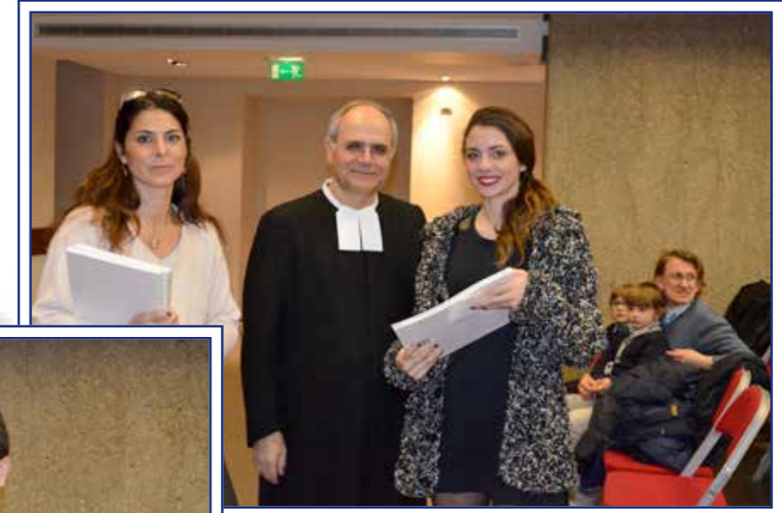
L'8 dicembre la festa dei diplomati 2014, con consegna dell'annuario, del distintivo del De Merode e della tessera degli Ex Alunni