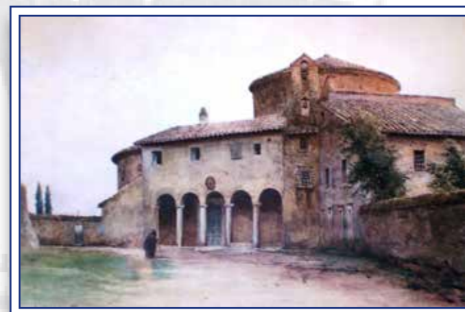
Santo Stefano Rotondo in un acquarello di Ettore Roesler Franz (avo di nostri ex-alunni)

A sinistra dell’ingresso, appoggiato ad un pilastro, si trova un bel seggio episcopale marmoreo, ritenuto di San Gregorio Magno. Nella cappella dei Santi Primo e Feliciano, l’abside di fondo conserva un prezioso mosaico del VII secolo con un Cristo raffigurato non crocefisso, ma semplicemente sovrapposto alla croce, ornata di gemme, fra i due summenzionati Santi.