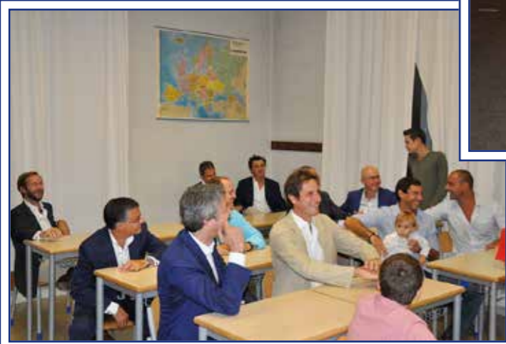
...ed il ritorno in classe!