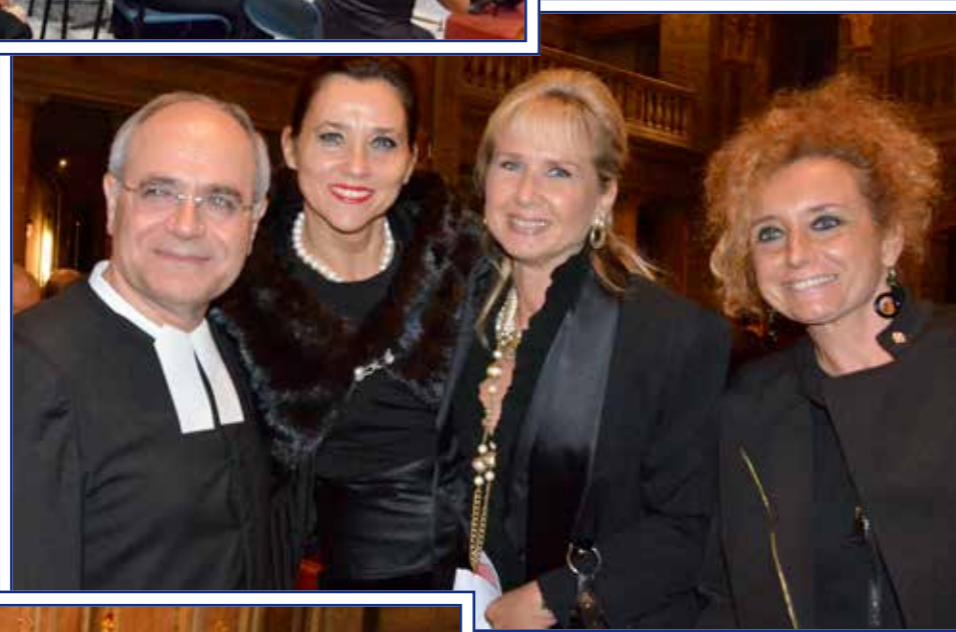
Le infaticabili "mamme" della Giunta, sostenitrici delle varie iniziative benefiche del Collegio, ed in particolare del nostro Concerto