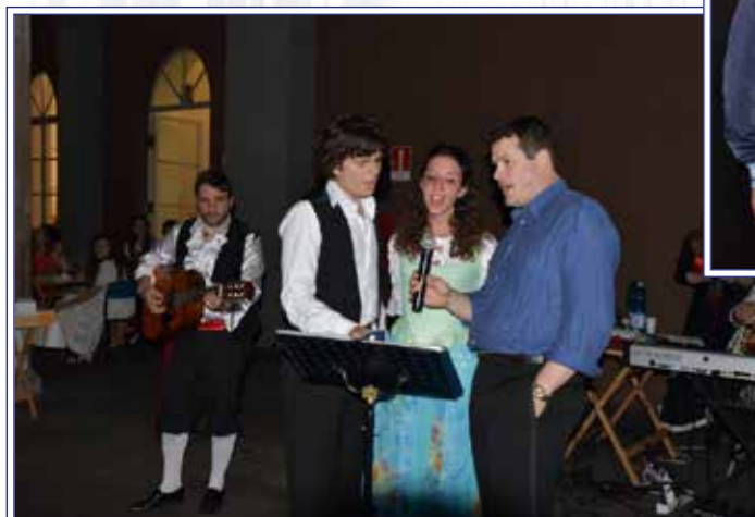
gli alunni in “semo romani” con gli Stornellatori