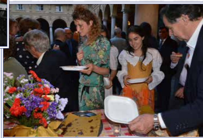
...l'imbarazzo della scelta