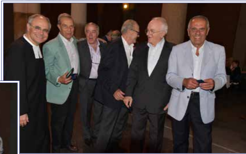
“ex” sempre presenti!

Alcuni momenti della festa degli ex alunni del 16 giugno scorso