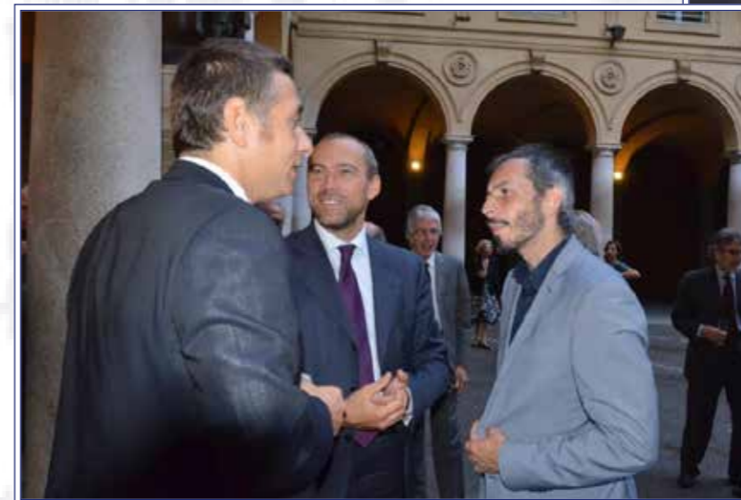
sempre attivi nell'Associazione...