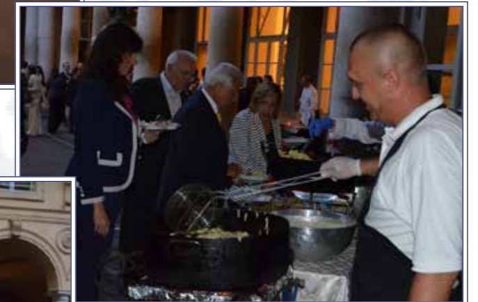
...e i fritti della tradizione