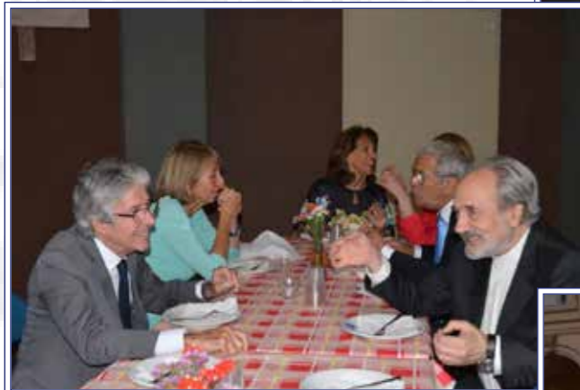
tavoli “alla buona”