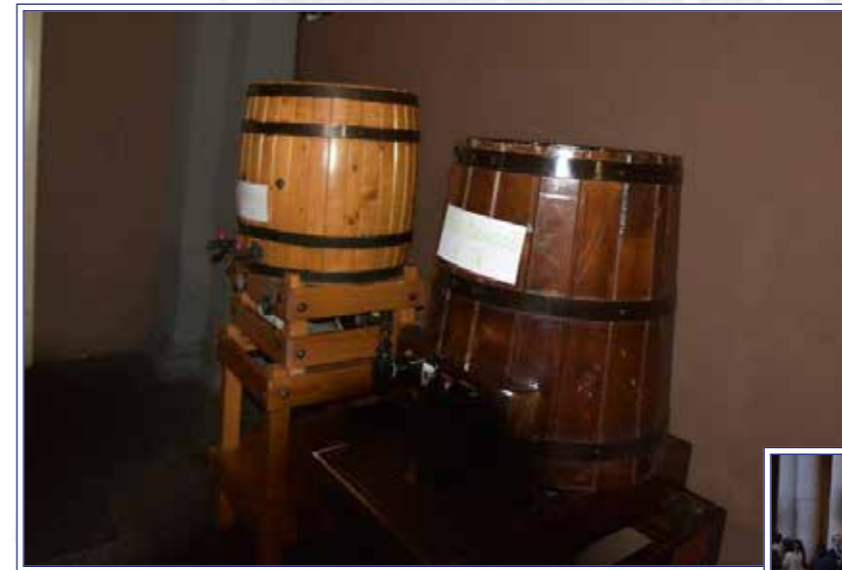
vino a go go...