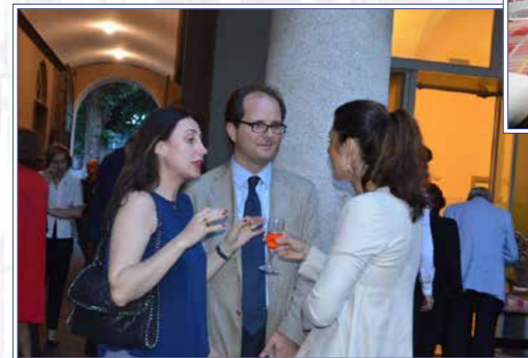
a colloquio con la Vicepresidente